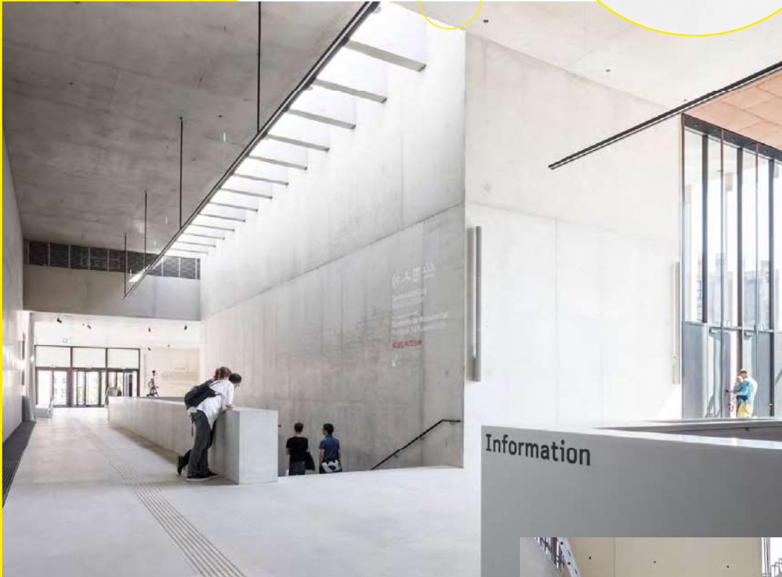
© Ute Zscharnt for David Chipperfield Architects