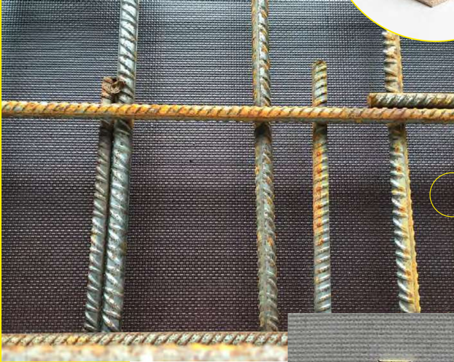
Schalungsplatte mit Bewehrung